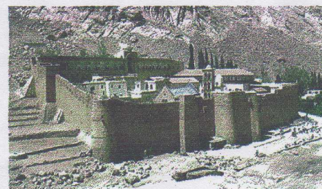
Sfintele sale moaște se află la mănăstirea Sfânta Ecaterina, pe muntele Sinai.

Iar ea, rușinându-i pe toți, cu înțelepciune și cu bună grăire, i-a înduplecat pe cei o sută cincizeci de învățați să creadă în Hristos, încât, stăruind ei în mărturisirea credinței, au fost arși în foc. Sfânta însă a fost supusă la chinuirea cumplită și ucigătoare a roatei și după multe alte chinuri, a primit sfârșit mucenicesc prin tăierea capului, luând cununa mărturisirii.