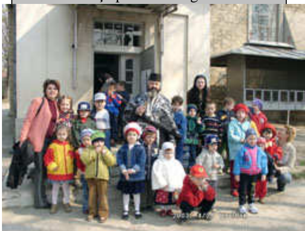
Cei mici au venit să primească Sfânta Împărtășanie

53. Și în toată vremea erau în templu, laudând și binecuvântând pe Dumnezeu. Amin.