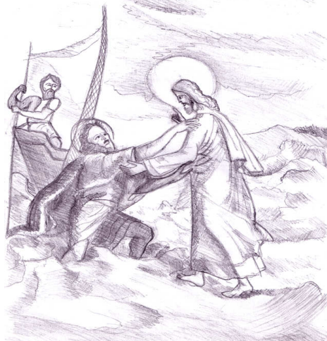
Afundarea lui Petru – grafică realizată de Bogdan Zahariuc

Vă dorim tuturor postire cu folos și ziditoare de suflet !