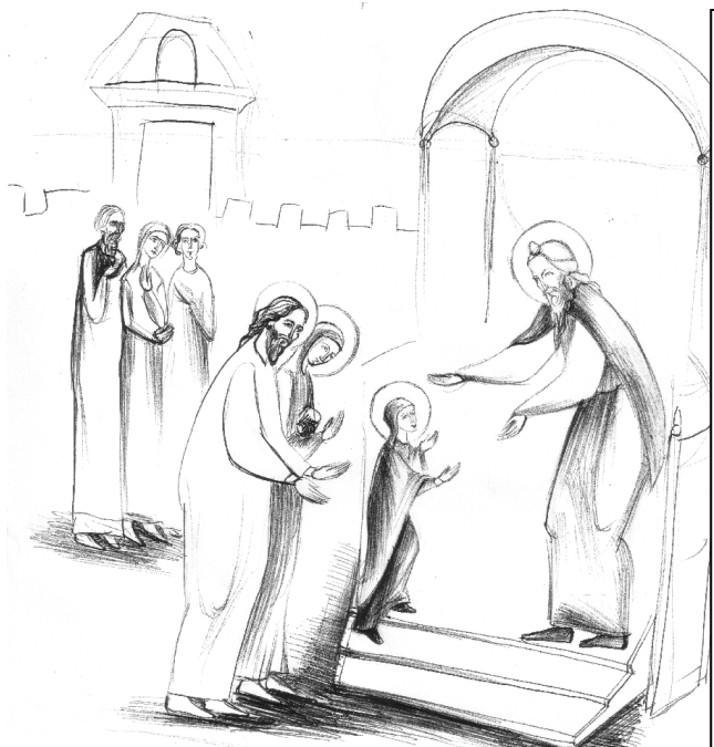
Icoană realizată de Maria Gheorghiuță

Cugetul meu cel omorât înviază-l cu lucrarea Vieții celei ce S-a arătat din tine lumii, ungându-mi rănilor și urmele păcatului, de Dumnezeu Născătoare, ceea ce ești una cu totul fără de prihană.