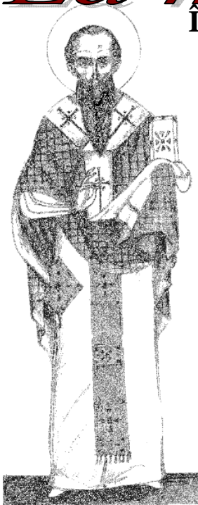
Sfântul Vasile cel Mare

La mulți ani 2006 ! În această săptămână, vineri: Botezul Domnului