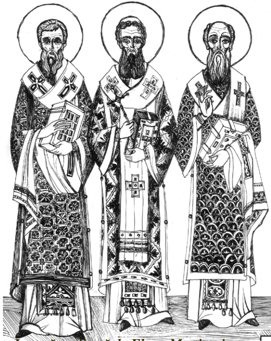
Icoană realizată de Elena Merticariu

Dumnezeire Una, Părinte, Fiule și Duhule, pentru rugăciunile lui Vasile, Grigorie și ale lui Ioan și ale Curatei Născătoarei de Dumnezeu, să nu mă desparți pe mine de slava Ta.