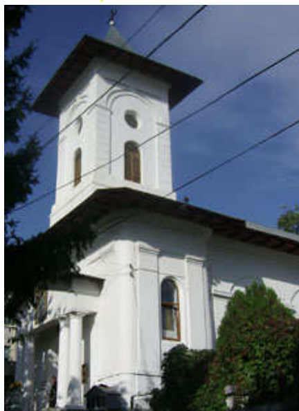
Biserica "Sf. Cuvioasă Parascheva", Iași

PROGRAMUL MANIFESTĂRILOR PRILEJUITE DE SĂRBĂTOAREA SFINTEI CUVIOASE PARASCHEVA