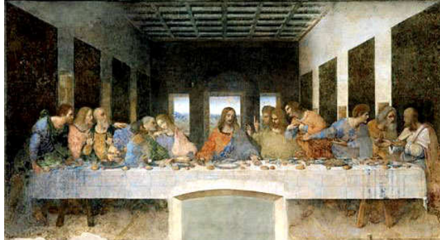
"Cina cea de taina" Leonardo da Vinci, 1495-1498, fresca, 460 x 880 cm

În această duminică se face pomenirea tuturor dreptilor părinți care din veac au bineplăcut lui Dumnezeu, de la Adam și până la Iosif, logodnicul Preasfintei Născătoare de Dumnezeu, după neamuri, precum ia numărat istoricește Evanghelistul Matei, dar și pomenirea proorocilor și proorociilor.