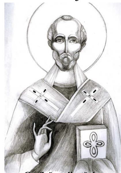
Grafică realizată de Maria-Elisabeta Gheorghiu-Vornicu

JOI, 6 decembrie: Sf. Ierarh Nicolae, Arhiepiscopul Mirelor Lichiei