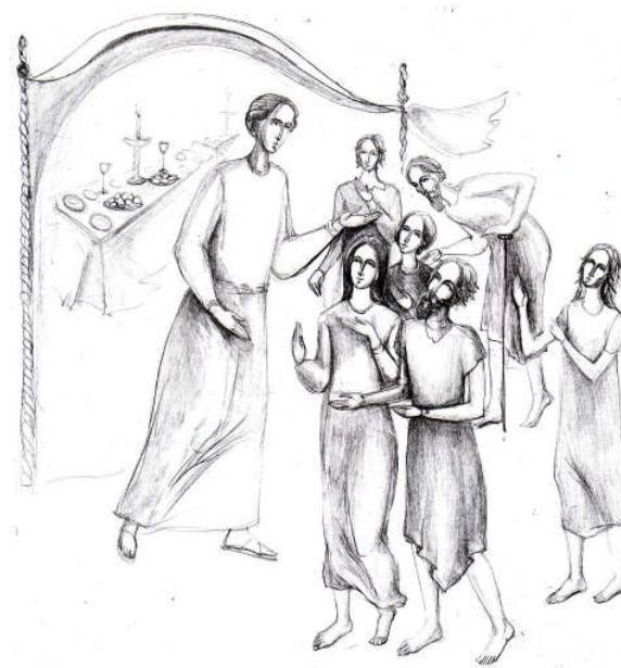
Grafică realizată de Maria Elisabeta Gheorghită Vornicu

Evangelhia duminicii: Pilda celor poftiți la cină (Luca XIV, 16-24)