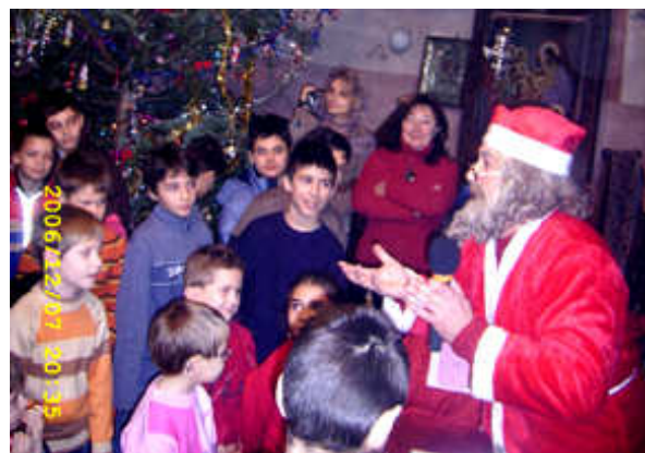
Moș Crăciun niciodată n-a lipsit la Biserica noastră