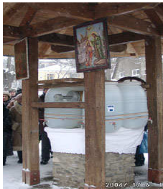
Agheasmă Mare săvârșită pe izvor la fântâna parohiei