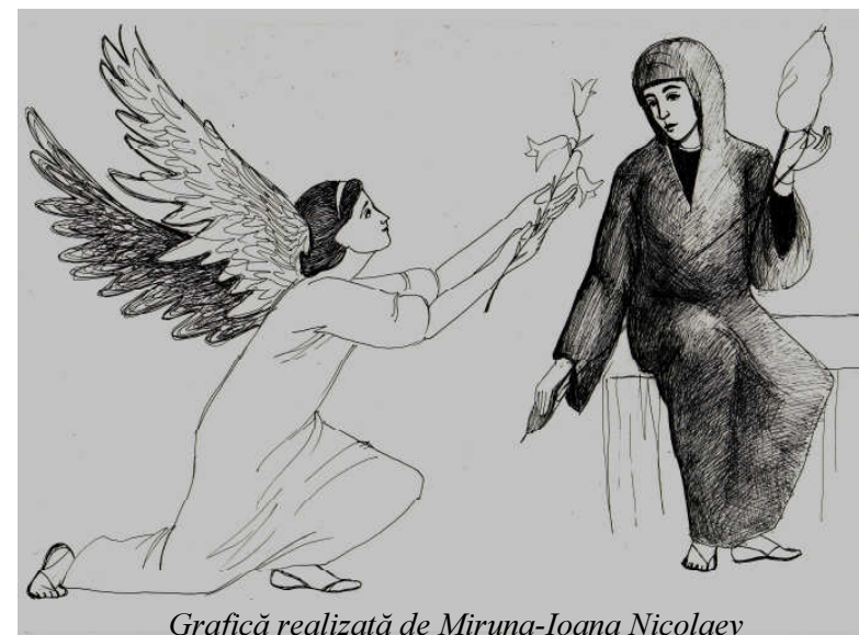
Grafică realizată de Miruna-Ioana Nicolaev

Evangelia duminicii Vindecarea slăbănogului din Capernaum (Marcu II, 1-12)