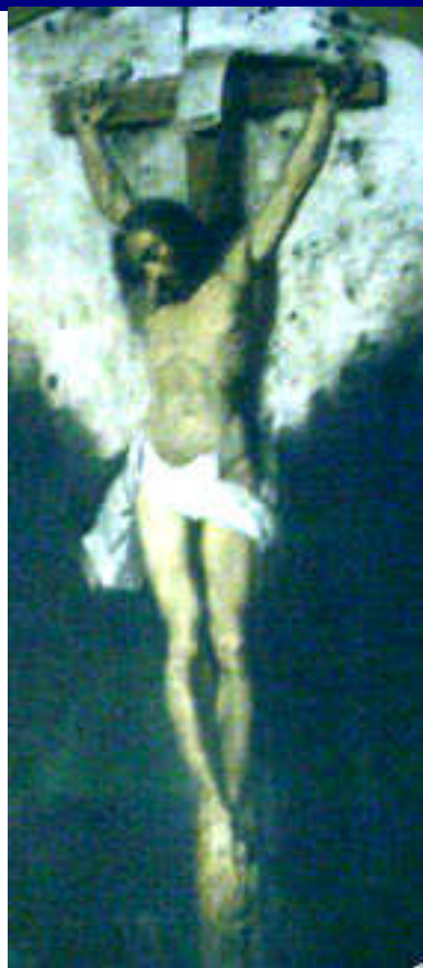
Răstignirea – realizare a picturii Giovanni Schiavonni. Se află pe peretele de sud al bisericii noastre

Am putea medita și la alte întrebări mai accesibile logicii umane. De exemplu, ce-ar putea omul să dea în schimb pentru trupul său ? Sau pentru sănătatea sa? Precum vedem, ceea ce primim de la Dumnezeu are o valoare ce nu se poate raporta la ceea ce putem noi face. Și totuși și sufletul și trupul și sănătatea și fericirea au corespondențe cu valorile din lumea aceasta. Nu vorbesc doar de acea stare de fericire trecătoare pe care o aduce împlinirea unui ideal sau dobândirea unui bun în lumea aceasta. N-aș vrea să stăruiesc asupra acestui tip de fericire, pentru că este o fericire trecătoare. A doua zi, lucrul pentru care ai fost foarte fericit că l-ai dobândit, îți poate aduce mari nefericiri. Aș vrea să privim mai atent asupra posibilităților din lumea aceasta de a dobândi cu adevărat fericirea, sau clipe de fericire, și vom