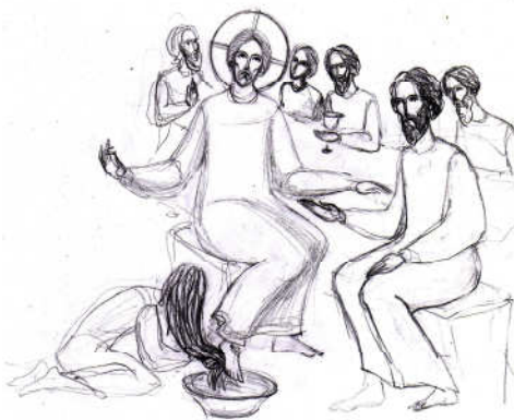
Grafică realizată de Maria -Elisabeta Gheorghiu Vornicu

După evenimentele pe care le-am pomenit în primele trei zile din Săptămâna Sfințelor Pătimiri, ajungem să ne gândim și la cele petrecute în Joia premergătoare pătimirilor Domnului. Avem bucuria de a înțelege măreția Domnului Hristos, Cel ce Dumnezeu fiind, a spălat picioarele