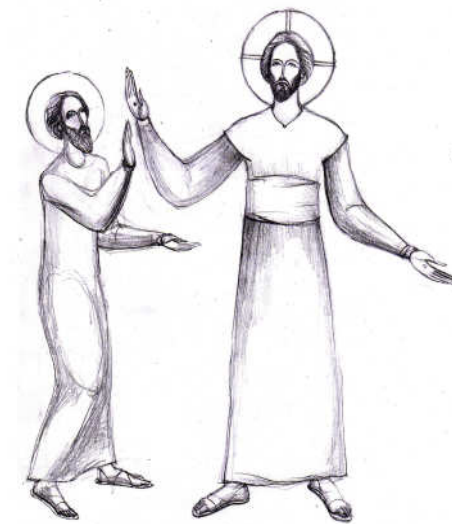
Încredințarea Sfântului Apostol Toma

un puternic impact misionar asupra epocii în care trăim.