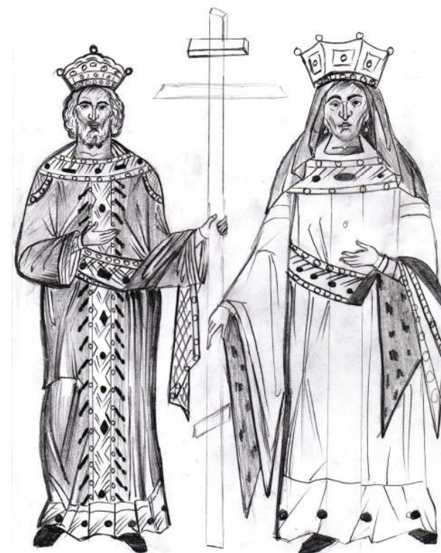
Grafică realizată de Vasile Vleju-Andrei

Cu prilejul sărbătorii Sfinților Împărați Constantin și Elena, ne îndreptăm cu respect gândul către toți enoriașii, colaboratorii și prietenii parohiei noastre care își serbează ziua onomastică și le adresăm cele mai frumoase urări de sănătate, împliniri în plan spiritual și profesional.