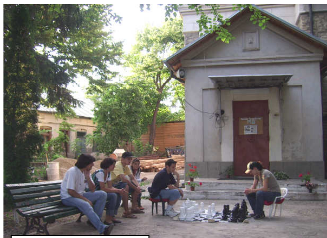
Partidă de șah

Alături de bogata activitate spirituală și cultural-filantropică susținută, Parohia Toma Cozma din Iași organizează săptămânal activități sportive și distractive gratuite pentru tinerii entuziaști din cadrul parohiei precum și a celorlalți colaboratori interesați. Aceste activități - dintre care amintim - petreceri aniversare, drumeții, jocuri sportive, club de șah, antrenamente pentru participări la competiții sportive etc. - alternează de la o săptămână la alta. Ultima acțiune de acest gen s-a desfășurat în seara zilei de duminică, 6 iulie a.c., constând într-o „escapadă” cu bicicletele în cadrul natural oferit de frumoasele regiuni din jurul cetății Iașului.