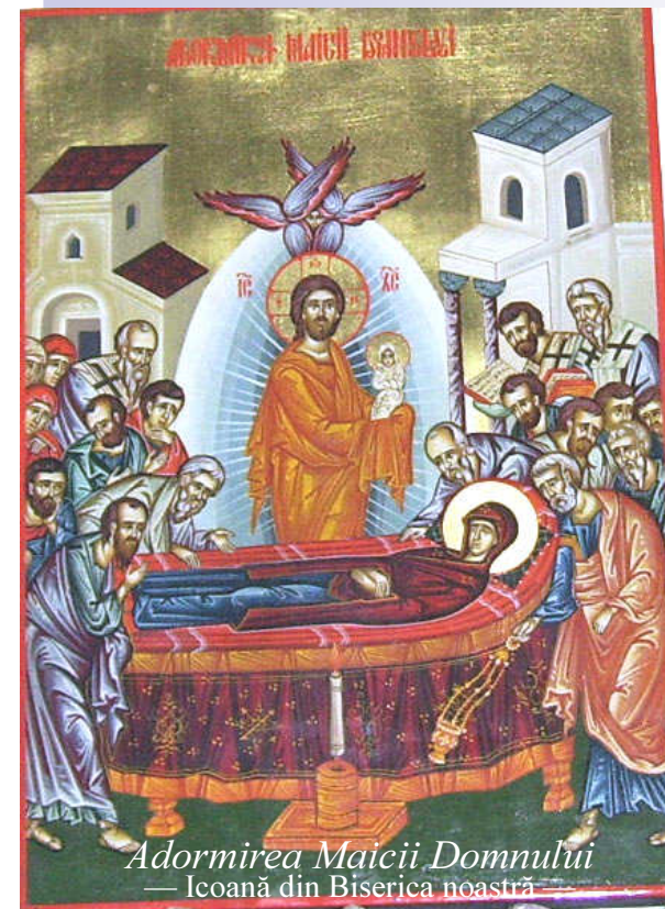
Adormirea Maicii Domnului — Icoană din Biserica noastră

Îndemn la solidaritate cu sinistrații din Moldova și Maramureș Detalii în ultima pagină