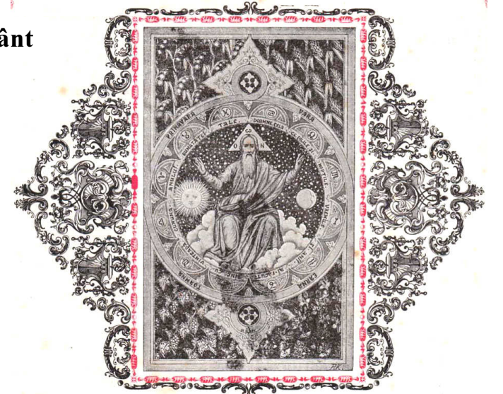
Începutul Anului Bisericesc Imagine din Evangheliul Arhivei Bisericii, anul 1911

Iubirea adevărată nu poate exista ca lucrare sau realizare omenească. Poate însă exista ca rod al părtașiei de iubirea dumnezeiască. Iar părtașia aceasta este cu puțință în Biserică, unde credincioșii se aduc pe ei înșiși lui Hristos și unde în toți credincioșii există Hristos cel unul și neîmbunătățit. Biserica este icoana la nivel crea a Dumnezeirii celei necreate, unificând după chipul Dumnezeului Treimic omenirea subzistentă în miile de ipostasuri. Izbutirea înfăptuirii acestei icoane este cu puțință prin perihoreza (întrepătrunderea) mădulelor Bisericii după modelul perihorezei Persoanelor Sfintei Treimi. De altminteri, Dumnezeu Treimic nu are drept icoană doar comuniunea miilor de ipostasuri ale