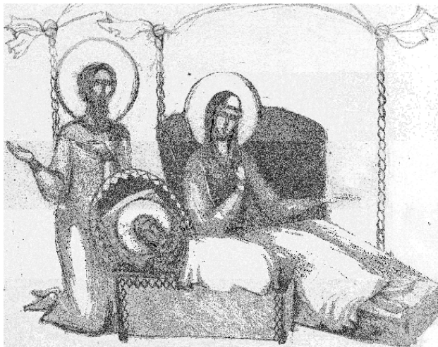
Nașterea Maicii Domnului