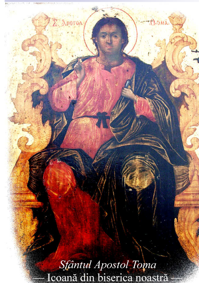
Sfântul Apostol Toma