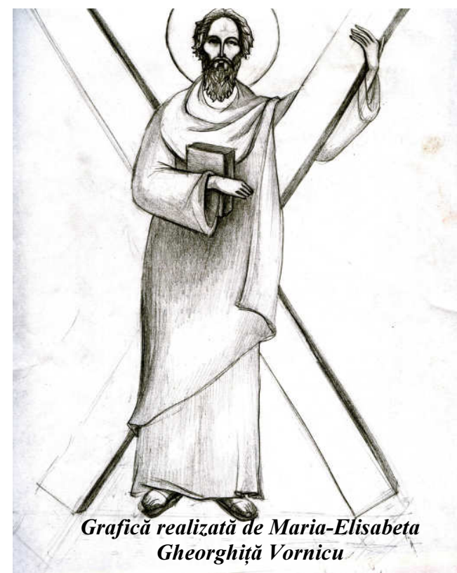
Grafică realizată de Maria-Elisabeta Gheorghiu Vornicu

Sâmbătă, 6 decembrie: Sfântul Ierarh Nicolae