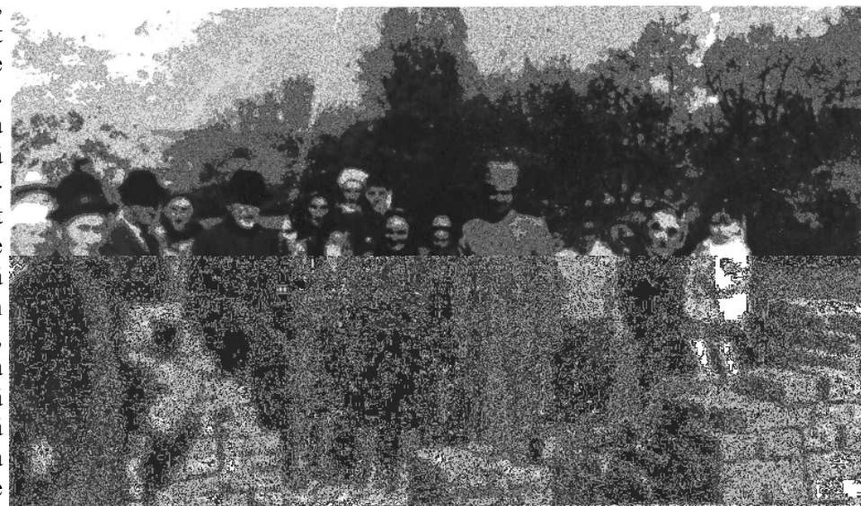
Evoluția lucrărilor la Biserica Veche din Prisacani