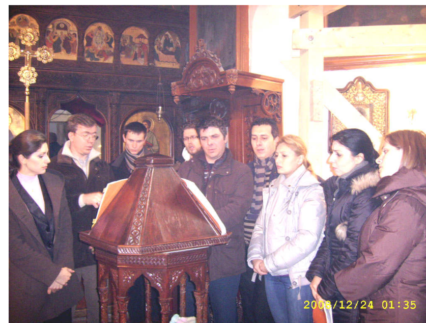
* Concert extraordinar de colinde susținut de Corul Parohiei Toma Cozma, în a treia zi de Crăciun - ziua dedicată membrilor acestui cor care în anul viitor va împlini un deceniu de când susțin muzical slujbele de la biserica noastră.