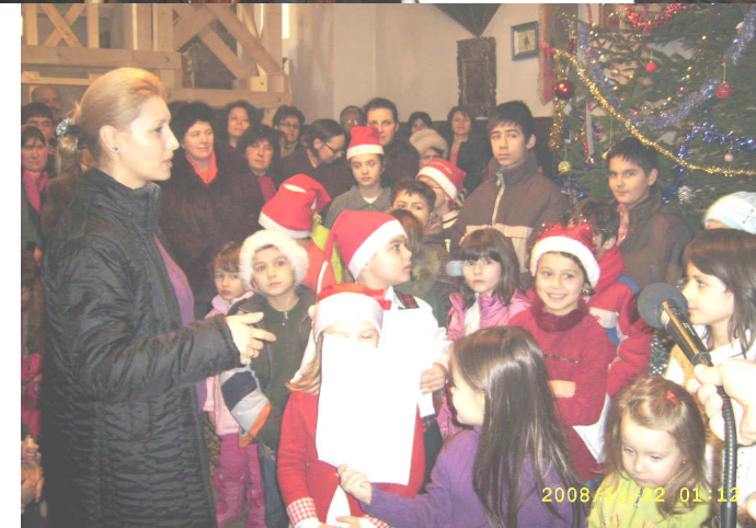
* Grupul micilor colindători preluându-și „partiturile”