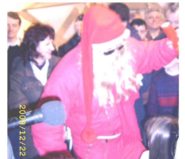
* Nelipsitul MOȘ CRĂCIUN la Biserica Toma Cozma, cu daruri pentru copii, cu ajutoare pentru nevoiași, cu surprize pentru cei mari, dar și cu diplome pentru Colindători