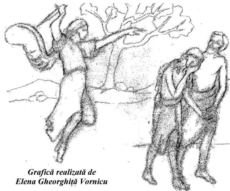
Grafică realizată de Elena Gheorghiu Vornicu