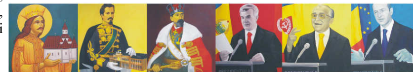
Proiect artistic realizat în cadrul proiectului Carte Blanche aux jeune createurs (2008) cu sprijinul financiar al Centrului Cultural Francez Iași, și sprijinul logistic al studioului de practici și dezbateri artistice (platforma colaborativă a Asociației Vector și Centrul de Cercetare al Facultății de Arte Plastice, Decorative și Design)

Vineri, 10 aprilie 2009, orele 18.00, la Galeriile de Artă Cupola