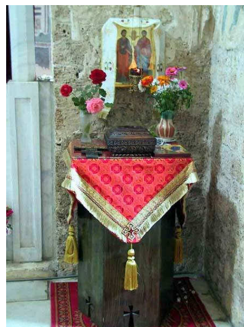
Moaștele Sfinților Cosma și Damian - Mănăstirea Sopočani din Kosovo

Acești sfinți și făcători de minuni doctori fără de arginți Cosma și Damian au o mare importanță pentru Biserica noastră Ortodoxă, fiind pomeniți în calendar, dar fiind vrednici de a fi pomeniți și la Sf. Liturghie, în prima parte a ei, la Proskomidie. Acești doctori Cosma și Damian s-au învrednicit a fi trecuți în rândul sfinților, iar cinstirea sfinților reprezintă o nesfârșită bogăție și izvor nesecat de îmbunătățire sufletească. Îi cinstim pe aceștia pentru că s-au împărtășit din darul și din lumina lui Hristos, precum și din jertfa Mântuitorului de pe Cruce, într-o măsură mai