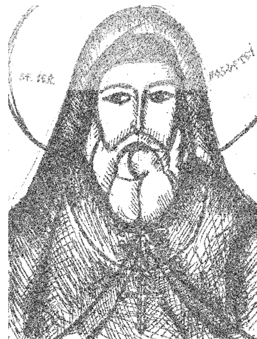
Grafică realizată de Raluca Negrea

ASTĂZI, 13 decembrie: Sf. Ierarh Dosoftei