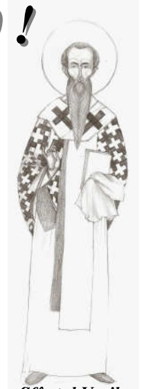
- Sfântul Vasile cel Mare — Grafică realizată de Maria-Elisabeta Gheorghiu Vornicu

Dragii noștri, Încet, încet, pecetea încă unui an s-a așezat pe nesimțite pe chipurile noastre, în suflete, dar și peste tot în jur. Pe de o parte, parcă, uneori, simțim deja cum puterile și sănătatea ne-ar încunoștința de timpul care a trecut. Pe de altă parte, însă, același timp ce s-a scurs ne-a lăsat mai înțelepți, cu experiență de viață mai bogată. Dificultățile de tot felul și adeseori frustrările și nedreptățile din jur ne-au determinat să vedem doar partea neguroasă a vieții. Desigur, însă, micile bucurii, alături de cei dragi întotdeauna ne-au înfrumusețat percepția a tot ceea ce trăim. Unii am coborât grumazul încet sub povara anilor. Alții ne-am ridicat cu fruntea plină de speranță și-ncrezători în viitor. Ne vine un an nou. Noi grijii și noi nădejdi. Un nou popas pentru conștiință și un bun prilej spre a ne cerceta despre ceea ce am reușit și ceea ce dorim a face în viitor. Să-ncepem împreună acest an cu Dumnezeu pe care îl rugăm să binecuvinteze și gândul și dorința noastră de mai bine. LA MULȚI ANI 2010 !