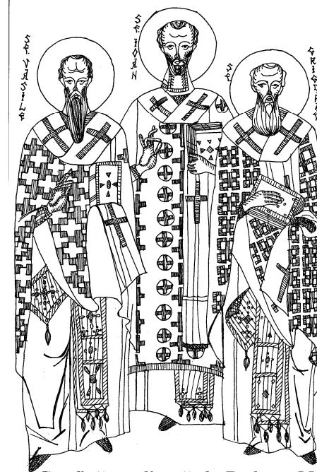
Grafică realizată de Raluca Negrea

Pe apărătorii și luminătorii Bisericii creștinești, pe învățătorii cei mari și înfrânătorii zăzaniilor diavolești, pe surpătorii eresurilor, pe stâlpii cei neclintiți ai Bisericii, podoabele cele mai alese ale ierarhilor și întocmai cu apostolii, și ai lumii învățători, pe marele Vasile cel cu dumnezeiasca minte; pe Grigorie, cel cu dulce glas; și pe Ioan luminătorul a toată lumea, să-i lăudăm credincioșii din toată inima și să le cântăm: bucură-te, treime de arhierie mult- lăudată !