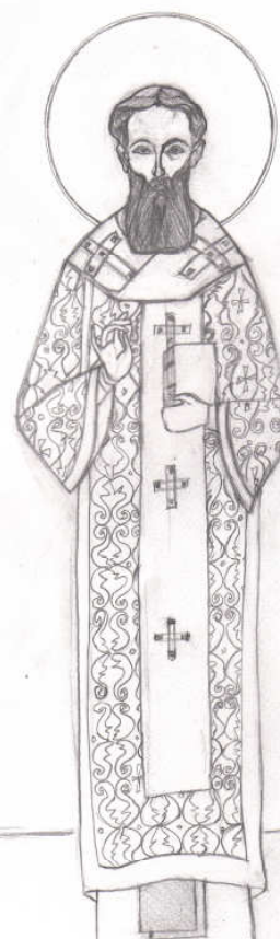
Sfântul Grigorie Palama

Evangelhia duminicii Vindecarea Slăbănogului din Capernaum (Marcu II, 1-12)