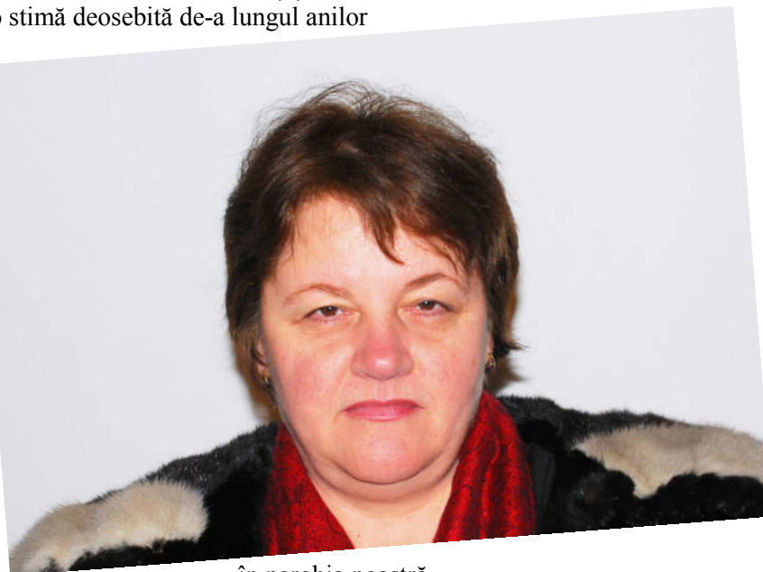
în parohia noastră.