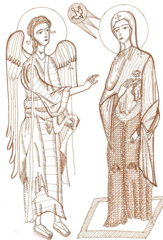
- Grafică realizată de Raluca Negrea -

AM INTRAT ÎN ULTIMA SĂPTĂMÂNĂ CÂND CREȘȚINIȚII SE MAI POT SPOVEDI ȘI ÎMPARTĂȘI. Programul - în pagina a 4-a