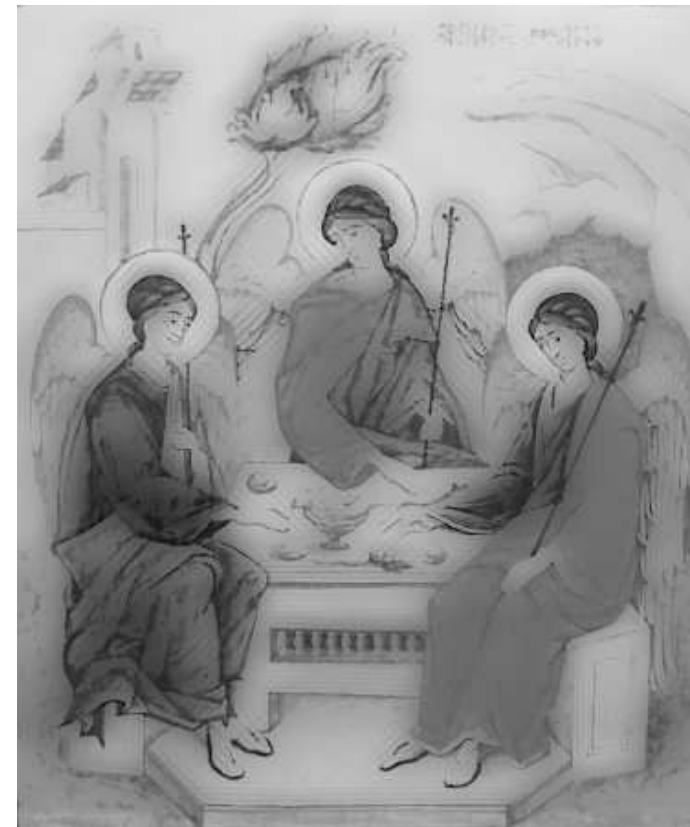
Grafică realizată de Raluca Negrea

Evangelia duminicii (Ioan VII, 37-53; VIII, 12)