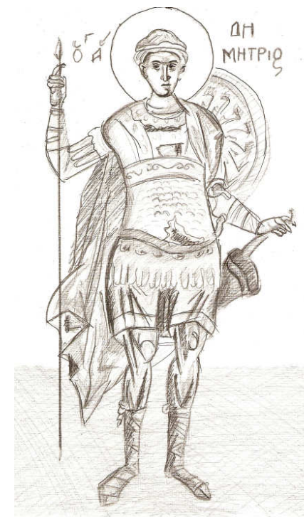
Grafică realizată de Paula Neagu

Marți, 26 octombrie: Sf. M. Mc. Dimitrie, Izvorătorul de mir