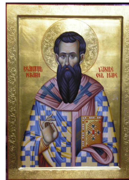
- Sfântul Vasile cel Mare — Icoană realizată de Cristian Ștefan

Cu cele mai frumoase gânduri, vă adresăm urări de sănătate, pace și bucurii duhovnicești și rugăm pe Bunul Dumnezeu să reverse Harul și darurile Sale cele bogate aducătoare de prosperitate și mulțumire sufletească în casa dumneavoastră. LA MULȚI ANI 2011!