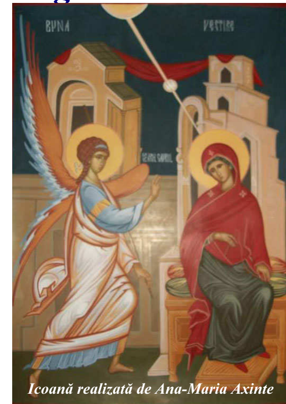
Icoană realizată de Ana-Maria Axinte