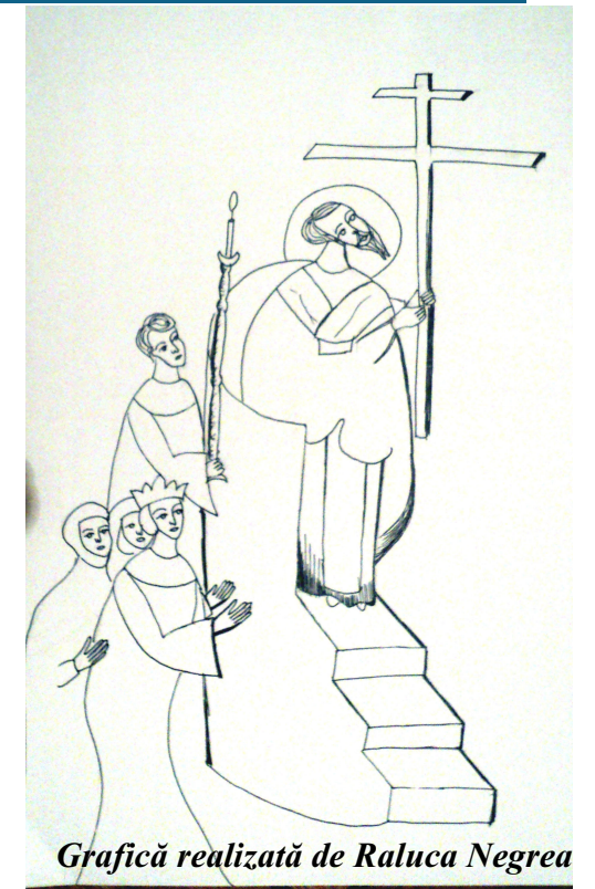
Grafică realizată de Raluca Negrea