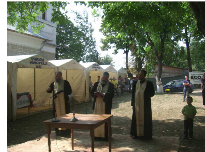
Cursului au susținut un frumos recital, în cadrul căruia s-au

În perioada 23-25 septembrie a.c., Bioma Agro Ecology Co a organizat în Parcul Parohiei Toma Cozma din Iași, cea de-a XI-a ediție a Târgului național ECOAGRIS. Una dintre noutățile acestei Ediții aniversare, la împlinirea a unui an de activitate, a constituit-o tematica târgului care a fost structurată pe trei secțiuni: I. Produse, utilaje și echipamente apicole; II. Produse ecologice, naturale și tradiționale; III. Produse ecologice pentru grădinărit.