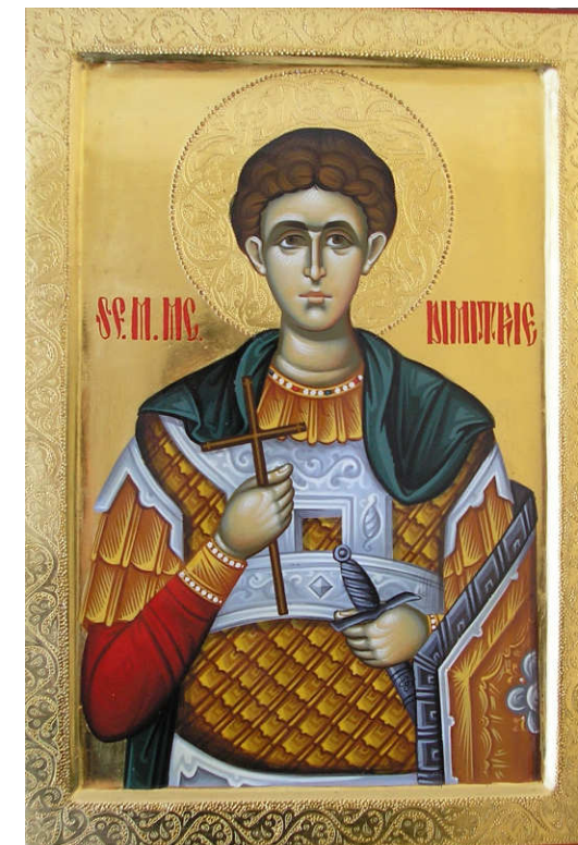
Icoană pictată pe lemn de Cristi Ștefan

Miercuri, 26 octombrie: Sf. M. Mc. Dimitrie, Izvorătorul de Mir