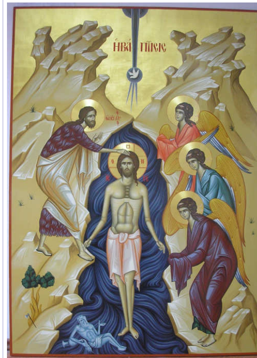
Icoană pictată de Cristian Ștefan

◆ AJUNUL BOBOTEZEI , vă va aduce binecuvântarea lui Dumnezeu pentru noul an, prin stropirea casei de către preot cu AGHEASMĂ MARE, care este „izvor de nesticăciune, dar de sfințenie, dezlegare de păcate, vindecare de boli, diavolilor pieire, îndepărtare a puterilor celor potrivnice, plină de putere îngerească”. (PROGRAMUL VIZITEI este prezentat în pagina 4) ◆ JOI, 5 ianuarie la ora 8.00 se va oficia în biserică Slujba de sfințire a Agheasmei Mari din ziua de Ajunul Bobotezei.