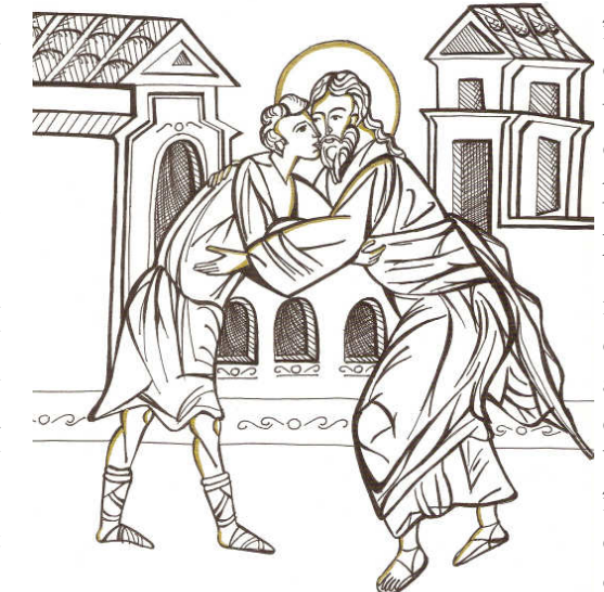
Grafică realizată de Raluca Negrea

Când noi știm că suntem păcătoși, nu trebuie nici să deznădăduim, nici să fim ușuratici la minte și leneși, căci amândouă acestea ne-ar duce la pierire. Adică deznădăduirea ne împiedică de a ne scula din căderea în păcate, iar ușurătatea minții face, ca și cei ce stau, să se poticnească și să cadă. Aceasta, așadar, ne răpește binele pe care îl posedăm, iară aceea, adică deznădăduirea, nu ne lasă a ne elibera de relele sub care noi suspinăm. Ușurătatea minții ne împinge iarăși afară din cer, unde noi ne aflăm, iară deznădăduirea ne aruncă în bezna răutății. Dacă noi însă nu deznădăduim, putem curând să scăpăm de această beznă. Socotește acum puterea amândurora, atât a ușurătății de minte, cât și a deznădăduirii! Satana a fost la început un înger bun, dar fiindcă din capul locului a fost ușuratic la minte și apoi a deznădăduit, de aceea a căzut așa de adânc, încât niciodată nu se va mai scula.