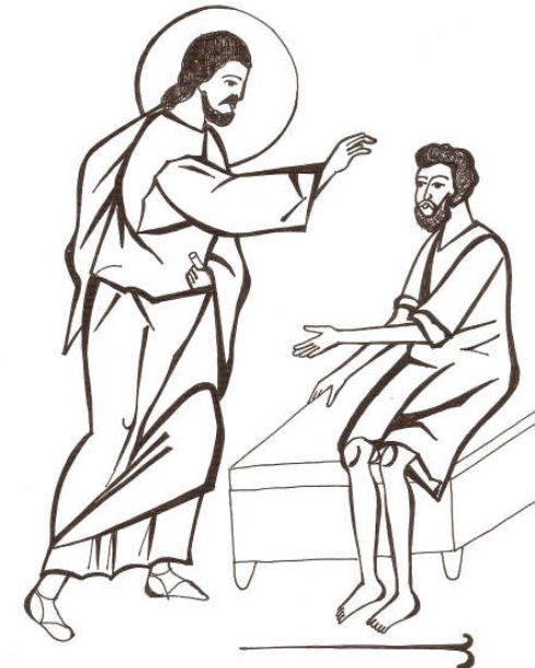
Grafică realizată de Raluca Negrea