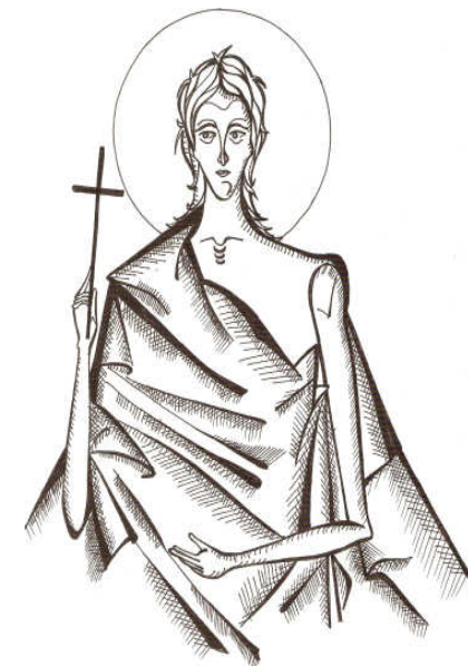
Grafică realizată de Raluca Negrea

32. Și erau pe drum, suindu-se la Ierusalim, iar Iisus mergea înaintea lor. Și ei erau uimiți și cei ce mergeau după El se temeau. Și luând la Sine, iarăși, pe cei doisprezece, a început să le spună cele ce aveau să I se întâmple: