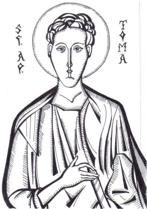
Grafică realizată de Raluca Negrea

Prin rânduială dumnezeiască, atunci când Mântuitorul Cel Înviat vine să se arate ucenicilor Săi, Sfântul Apostol Toma nu era de față. Aceștia îi vor vesti: "L-am văzut pe Domnul!" (Ioan 20, 25). El le răspunde însă răspicat: "Dacă nu voi vedea eu în mâinile Lui semnul cuielor și dacă nu-mi voi pune degetul meu în semnul cuielor și dacă nu-mi voi pune