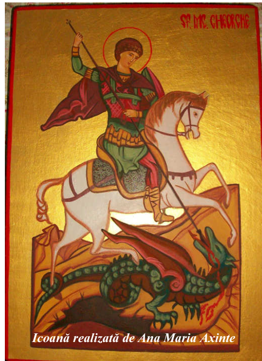
Icoană realizată de Ana Maria Axinte

În această sfântă zi, dorim să-i felicităm pe creștinii noștri care își serbează ziua numelui. De asemenea, adresăm