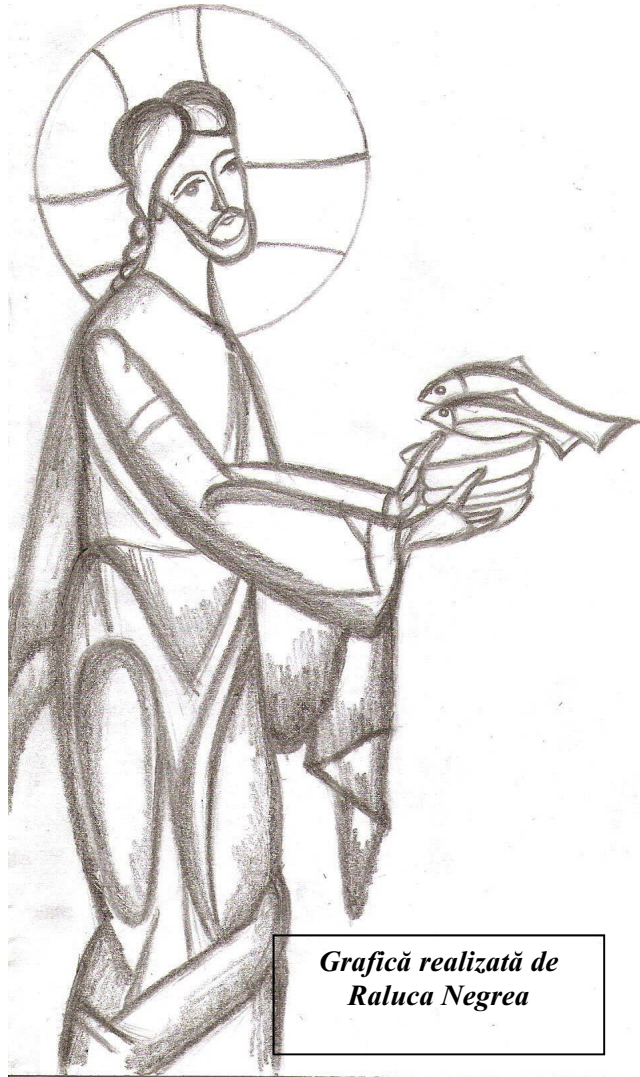
Grafică realizată de Raluca Negrea

Duminica aceasta, a opta după Rusalii, prin Evanghelia care s-a citit, ne înfățișează o minune pe care Mântuitorul Iisus Hristos o