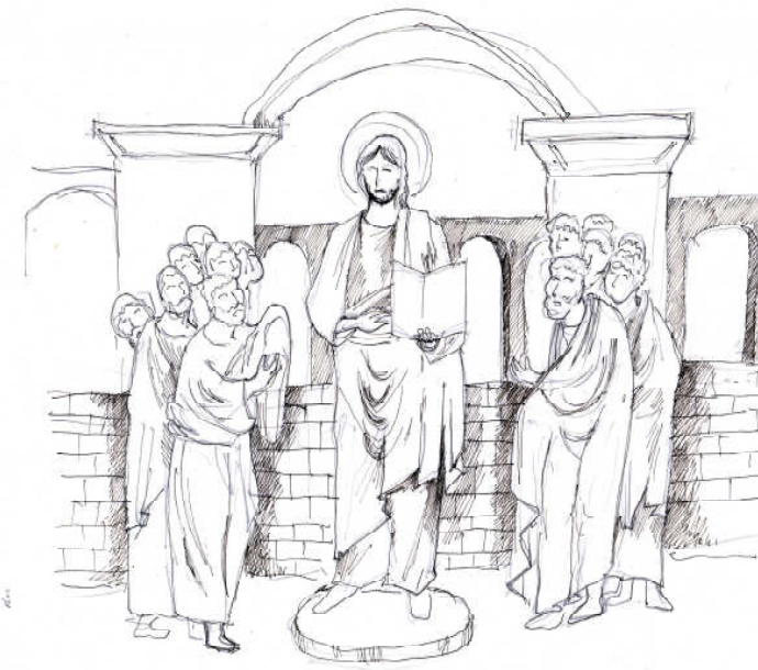
Grafică realizată de Radu Macsimov