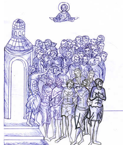
Grafică realizată de Roxana-Elena Ichim

Evanghelia duminicii Pilda Fiului risipitor (Luca XV, 11-32)