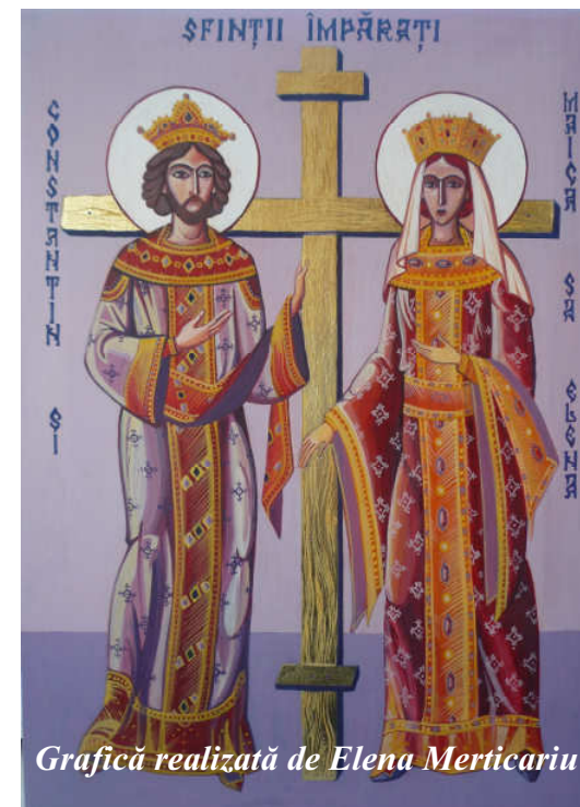
Grafică realizată de Elena Merticariu

Martți, 21 mai: Sf. Împărați Constantin și Elena