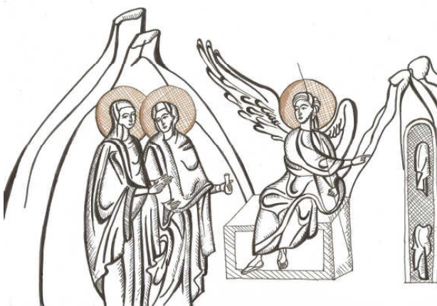
Grafică realizată de Raluca Negrea

45. Și aflând de la sutaș, a dăruit lui Iosif trupul.