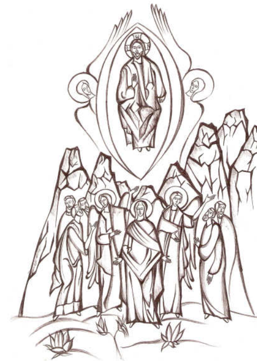
Grafică realizată de Raluca Negrea

Evangelia Înălțării Domnului — Luca 24, 36-53 —