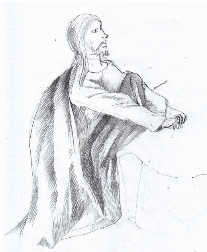
Grafică realizată de Radu Macsimov

Duminica Sfinților Părinți de la Sinodul al IV-lea Ecumenic alături evangheliei duminicale și evanghelia specială din capitolul al XVII-lea de la Ioan, ce cuprinde Rugăciunea Arhierescă , rugăciune pe care Hristos o rostește pentru Sine, pentru lume și pentru toți cei care vor crede în El de-a lungul veacurilor: Aceasta este viața veșnică: Să Te cunoască pe Tine, singurul Dumnezeu adevărat, și pe Iisus Hristos pe Care L-ai trimis (Ioan 17, 3). Așadar, nu trebuie să privim viața veșnică drept stare de lux și confort, de bunăstare și mulțumire, o „festivitate de premieră” la